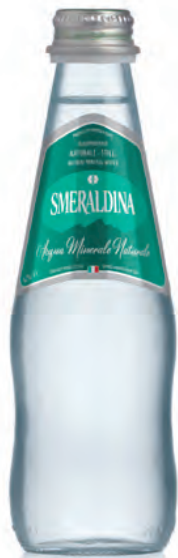
0,25 lt. naturale 8.47 Oz still