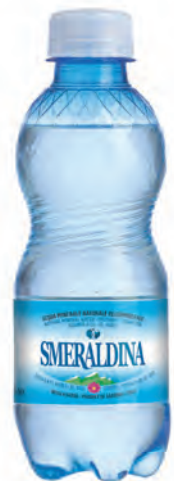
0,25 lt. frizzante 8.47 Oz sparkling