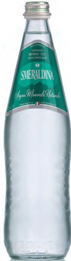
0,75 lt. naturale 25.3 Oz still