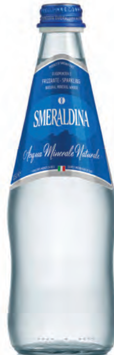
0,50 lt. frizzante 16.9 Oz sparkling