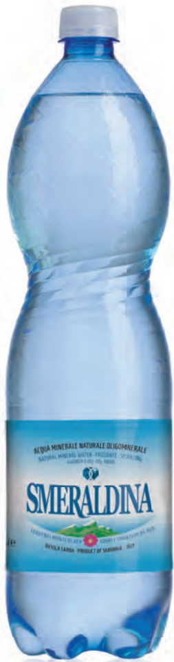
1,50 lt. frizzante 50.72 Oz sparkling