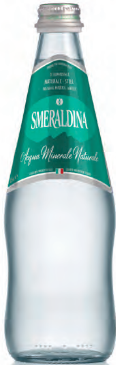
0,50 lt. naturale 16.9 Oz still