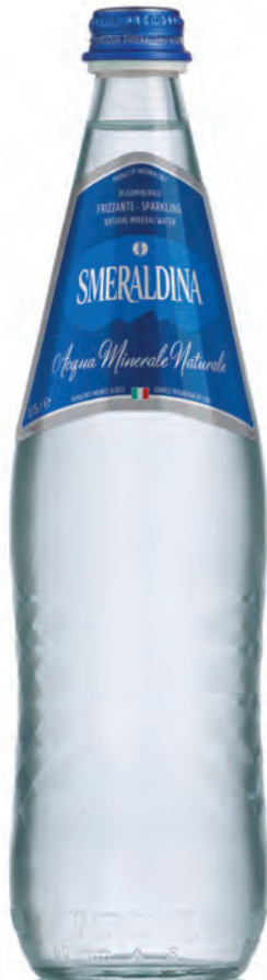
0,75 lt. frizzante 25.3 Oz sparkling