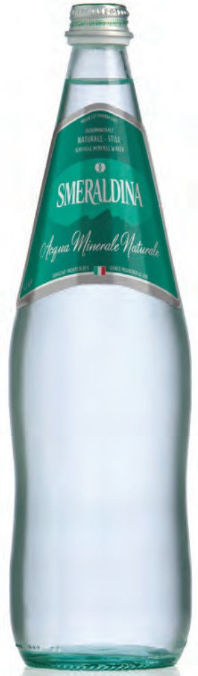
1,00 lt. naturale 33.8 Oz still