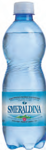
0,50 lt. frizzante 16.9 Oz sparkling