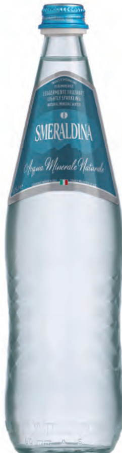
0,75 lt. leggermente frizzante 25.3 Oz lightly sparkling