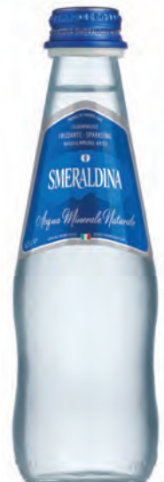
0,25 lt. frizzante 8.47 Oz sparkling