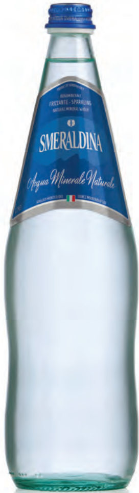
1,00 lt. frizzante 33.8 Oz sparkling