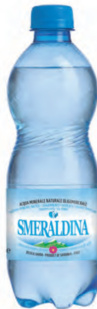
0,50 lt. leggermente frizzante 16.9 Oz lightly sparkling