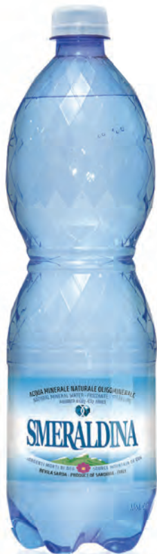
1,00 lt. frizzante 33.8 Oz sparkling